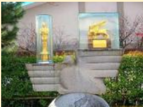
大映撮影所跡 (ブルーリボン賞・金熊賞)