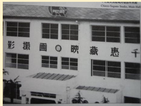
知恵蔵プロダクション