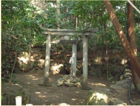
木島神社御柱鳥居